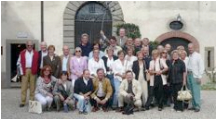
Una gran bella domenica